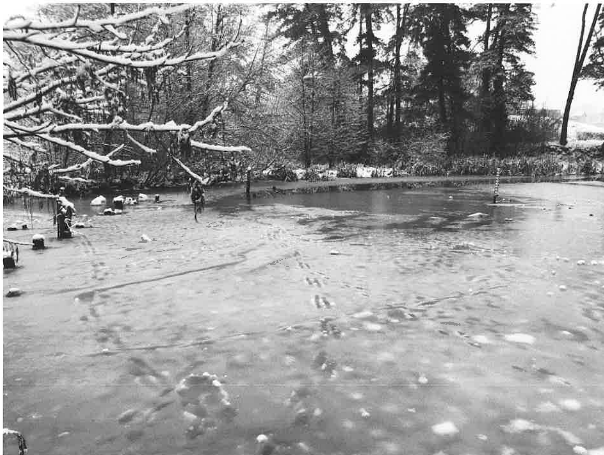
Figura 1. Aspectul Ochiului termal la data prelevării probelor

Temperatura aerului la momentul prelevării probelor a fost de 2 0 C. Volumul de apă în Ochiul Mare era extrem de redus, iar suprafața apei cu excepția zonei de izvor, era acoperită cu zăpadă moale de circa 10 cm grosime.